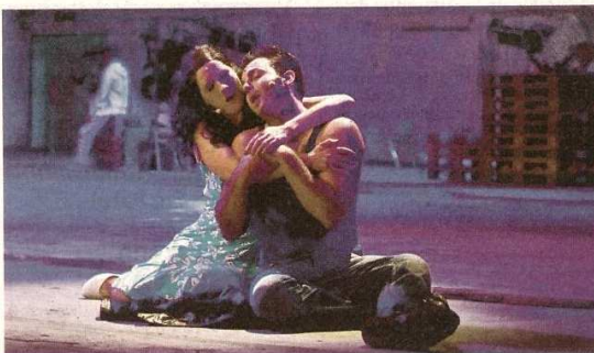
Maria und Tony: Opfer eines Bandenkrieges

» Karten kann man telefonisch unter der Nummer 0049-651-7181818 reservieren oder übers Internet: www.theater-trier.de . Parkmöglichkeiten gibt es am Moselauenparkplatz P&R, von da aus kann man entweder per Shuttlebus oder zu Fuß zur Bobinet-Halle. Auf dem Bobinet-Areal stehen lediglich Behindertenparkplätze zur Verfügung